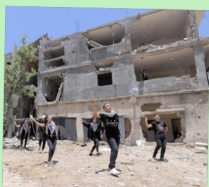
Dakbé : danse traditionnelle de Palestine. Par un groupe de danseuses et danseurs venant de GAZA

20 h : projection en avant-première du film YALLAH GAZA