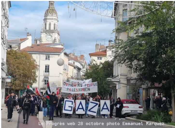
Le Progrès web 28 octobre photo Emmanuel Marquez

Ce Samedi 28 octobre à Bourg-en-Bresse, une Manifestation pour dire «Halte aux massacres à GAZA, Cessez-le-Feu immédiat»